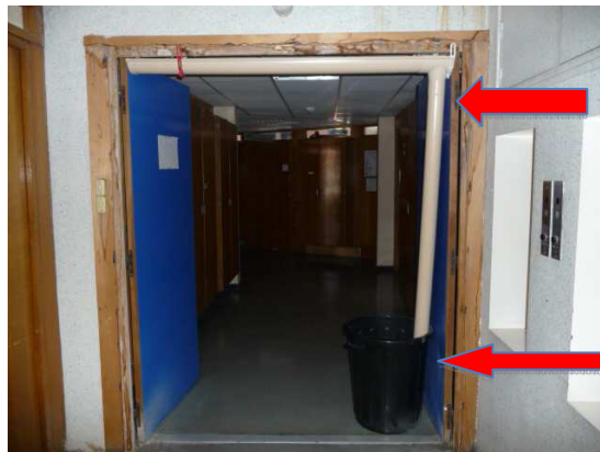
Portes coupe-feu bloquées par un système « Géo-Trouvetou »

Vous trouverez ci-dessous des photos prises ce jour qui démontrent l'état de délabrement des plafonds de ces services. Ces infiltrations répétées font craindre un risque sérieux d'accident électrique mettant en danger potentiel les personnels et l'outil de travail.