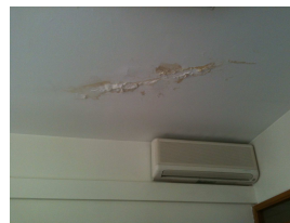
Des plafonds en piteux état !