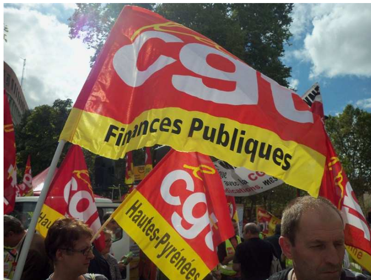
Manifestation du 9 octobre à Toulouse

En cas de difficulté, n'hésitez pas à vous rapprocher des militants CGT Finances Publiques.