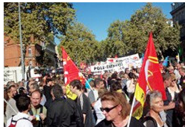
La mutualité Française était présente sur la manifestation pour dire non à un impôt sur notre santé !