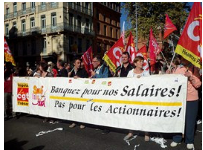
Plus de 5.000 manifestants à Toulouse. 150 collègues réunis derrière la banderole unitaire.

La CGT sera à l'initiative, pour continuer d'agir avec les salariés sur chaque lieu de travail, pour une véritable alternative à la crise et gagner du progrès social pour tous.