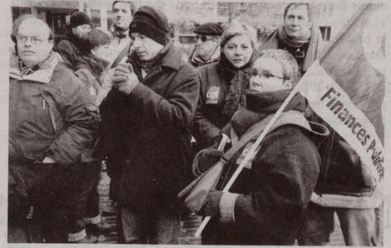
Manifestation hier à Toulouse. Les 28 suppressions d'emploi seraient effectives à partir du mois de septembre.